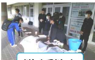
クリーンアクション