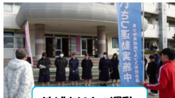
地域あいさつ運動