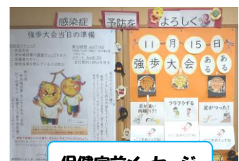
保健室前メッセージ