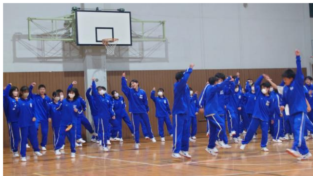
勇気をだして やってみよう!