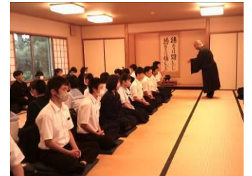
高台寺の座禅体験